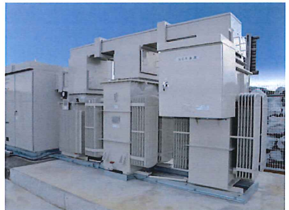
無効電力補償装置 (容量：600KVA)