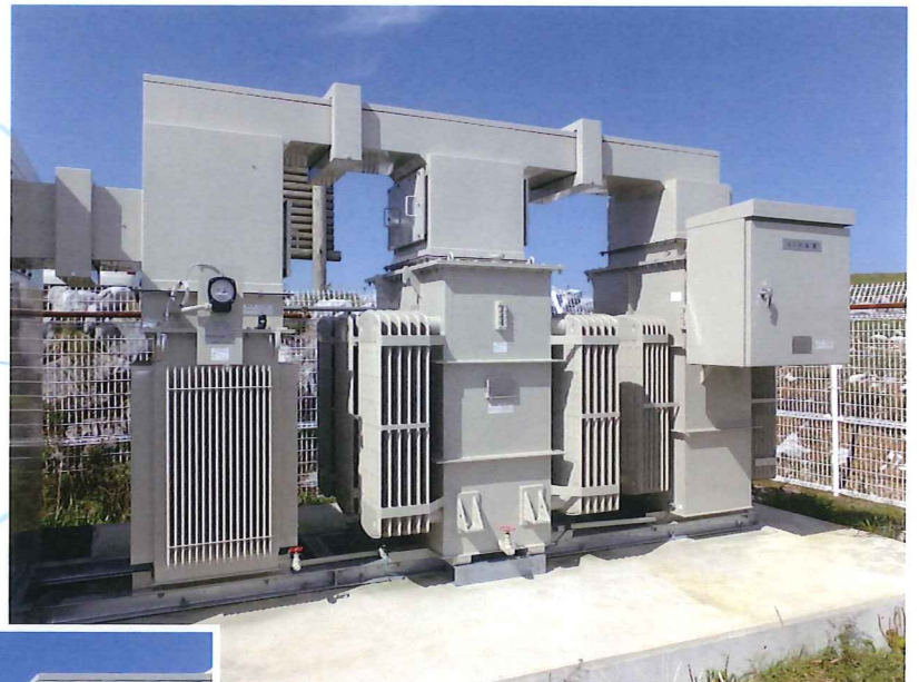
SCR装置・分路リアクトル・変圧器